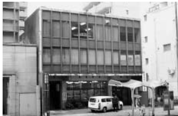
愛知県印刷会館外観