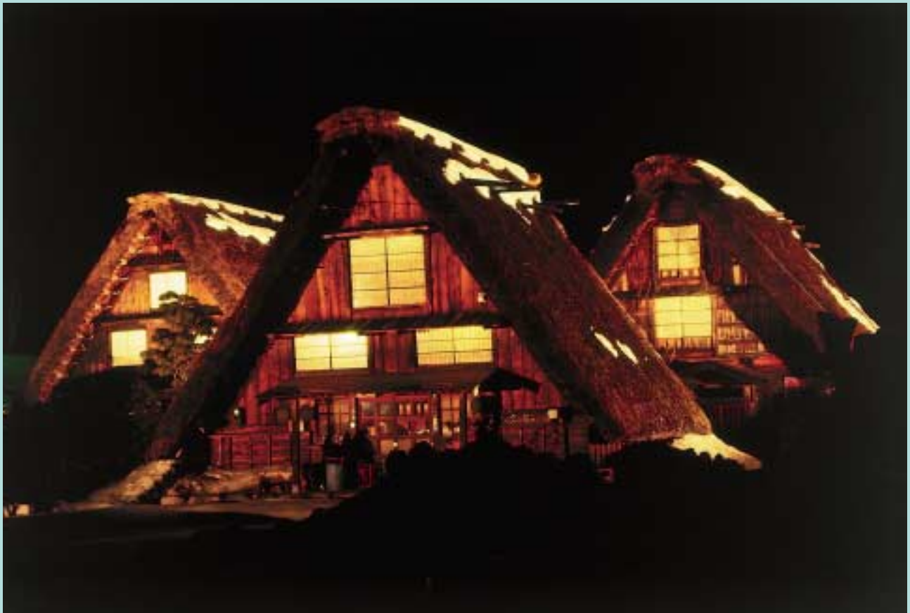
ライトアップされた白川郷