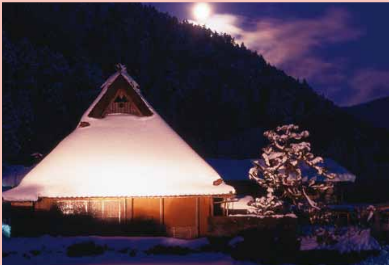
美山町のかやぶき屋根にかかる雪と月