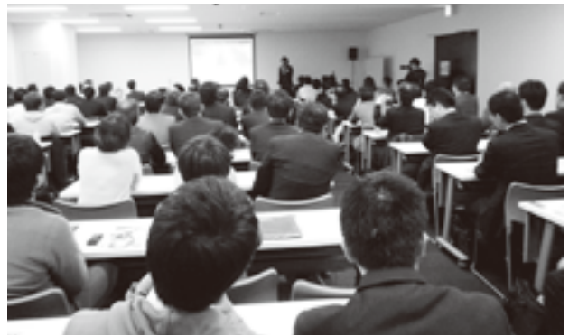
110名の参加者を得たセミナー

DMはさらに進化していき、遠方から来る人や地図が読めない人のために、手書きの地図を添え、それでもわからない時のため、私の携帯電話を明記しました。また周辺のランチの店も紹介しました。こうしたことを続けたおかげで、来場数は前年比300%を達成し、新規のお客様も増えました。