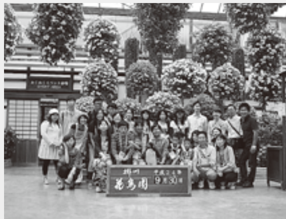
東三河地区からの参加者行

いました。当初の予定では掛川城と城下町ウォーキングが組み込まれていましたが、あいにく台風の影響が出始めたため、こちらは急遽中止になりました。