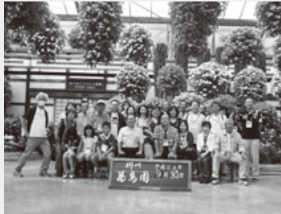
岡崎地区からの参加者行