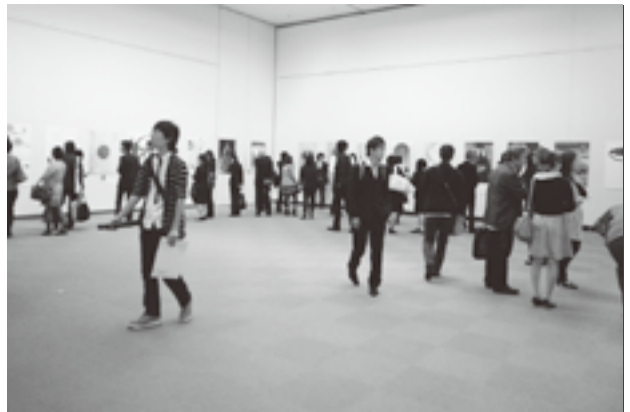
賑わいを見せるポスターグランプリ展示会場