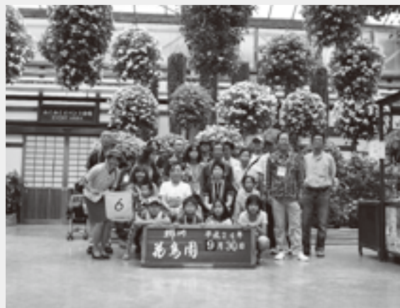
東三河地区からの参加者行