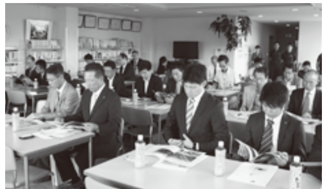
会議室での愛印工組一向