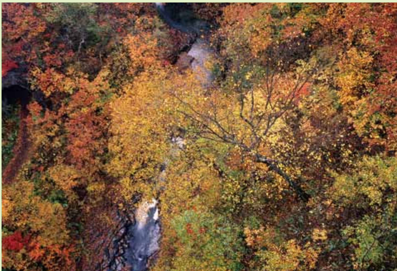
白山スーパー林道の紅葉