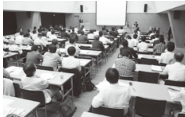
110名が参加した中部地区セミナー

それによると、全印工連が5月にソフトウェアに関する調査（「DTPソフトウェア環境について」アンケート調査）を実施したところ、「メーカー交渉で期待することは何ですか?」という質問には「価格交渉によるコスト削減」、また「交渉して欲しいメーカーは?」という質問には「Adobe Systems」との回答が最も多かった。このアンケート調査結果を受け、全印工連の教育・労務