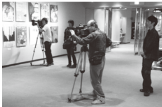
TV放映を行なう放送各社

また、高井理事長は「私案ですが」と断った上で、今回のポスターグランプリを総括した上で、「来年