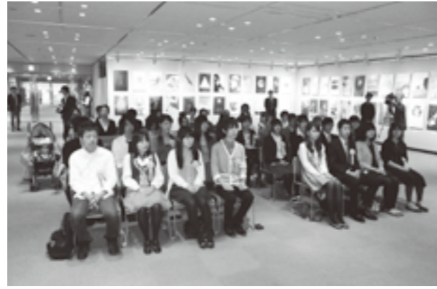
表彰を受ける皆さん