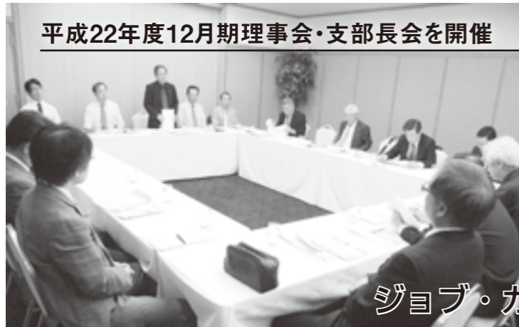
グランドエクシブ浜名湖での理事会