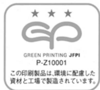
印刷製品へのGPマーク表示例

①企画制作の環境配慮基準がある、②環境配慮基準に該当する製品を提案、③デジタルによる印刷見本出力、④デザインのデジタル化