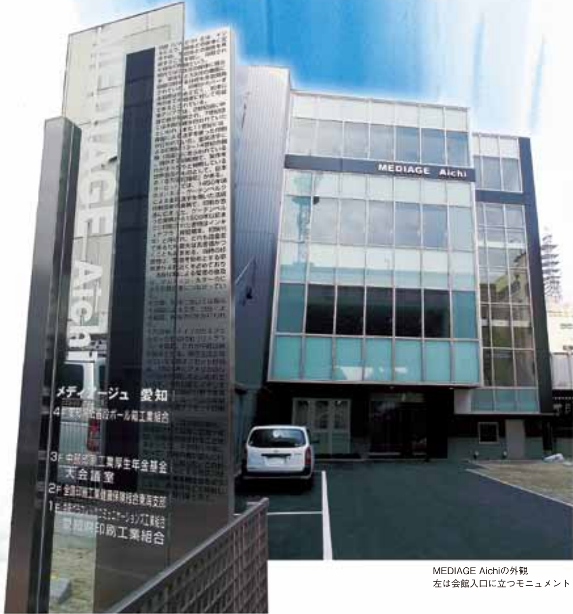
MEDIAGE Aichiの外観 左は会館入口に立つモニュメント