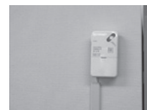
印刷機と印刷機との間の柱に設置