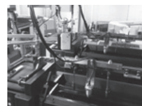
印刷機の上に設置(インク壺からやや離して)