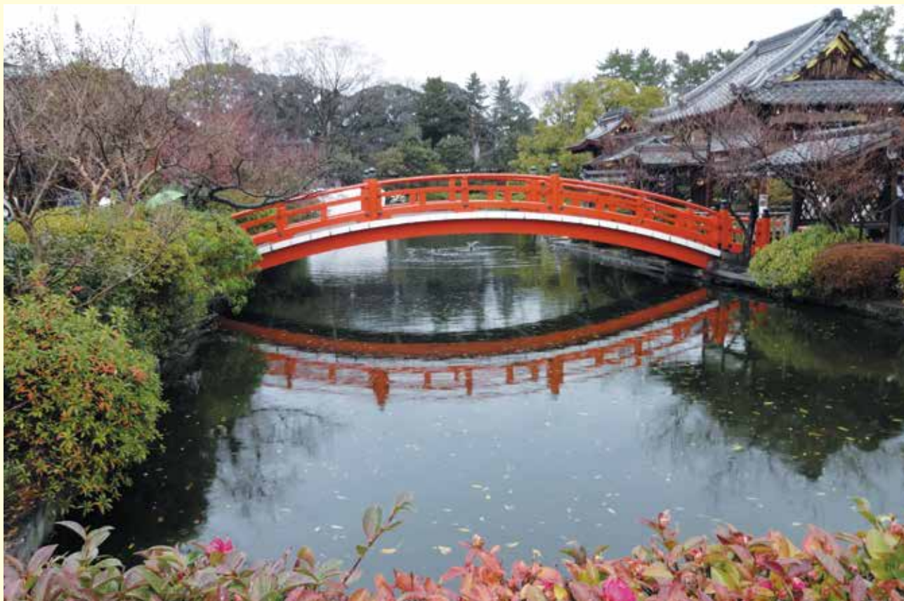
神泉苑（京都市中京区）