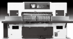
最大断裁幅 1370mm SC-137Z