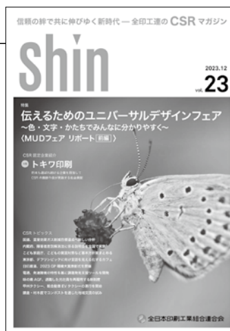
A4判12頁 全印工連CSR マガジン「Shin」 2023.12