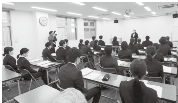
昨年度の「印刷会社の新入社員研修会」

門用語、安全管理教育と共に実際に工場見学を行ないます。工場見学では、仕事の流れ、現場での注意点、初歩的なノウハウ、さらに、印刷現場で起こりやすい間違った印刷や印刷工程での品質管理などを学びます。