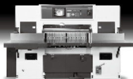
最大断裁幅 1030mm SC-100Z