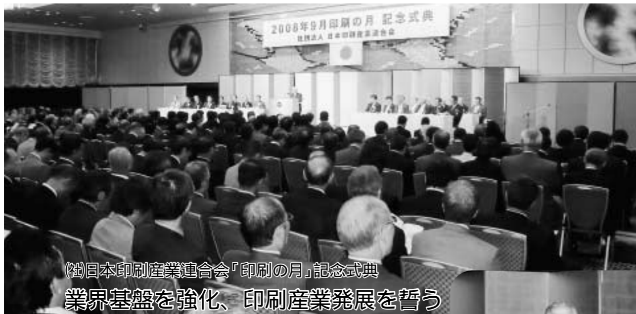
(社)日本印刷産業連合会「印刷の月」記念式典 業界基盤を強化、印刷産業発展を誓う