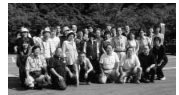
岡崎支部一行が記念撮影

今回のレクリエーションは、思いもよらぬ雷雨に遭遇するというアクシデントはあったものの、鮎の塩焼きを堪能し、京都土産の買い物も楽しみ、参加者は有意義な一日とすることができました。