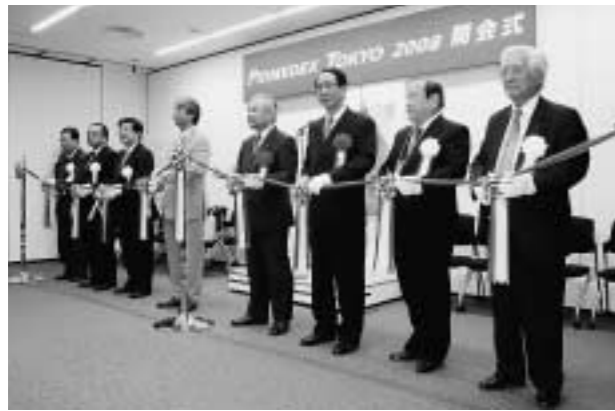
開会式でのテープカット